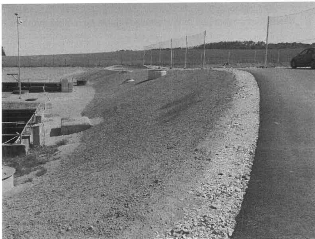
Kamerový systém na sloupu osvětlení. Vidí na jímky a nové těleso.