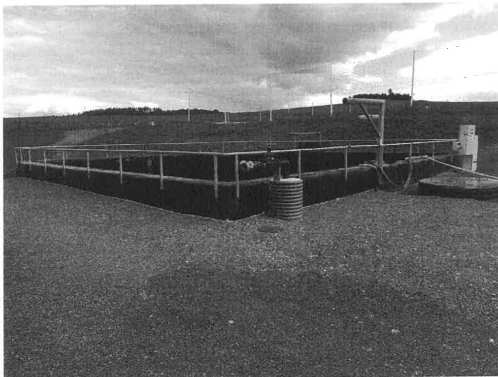
Nová jímka J2