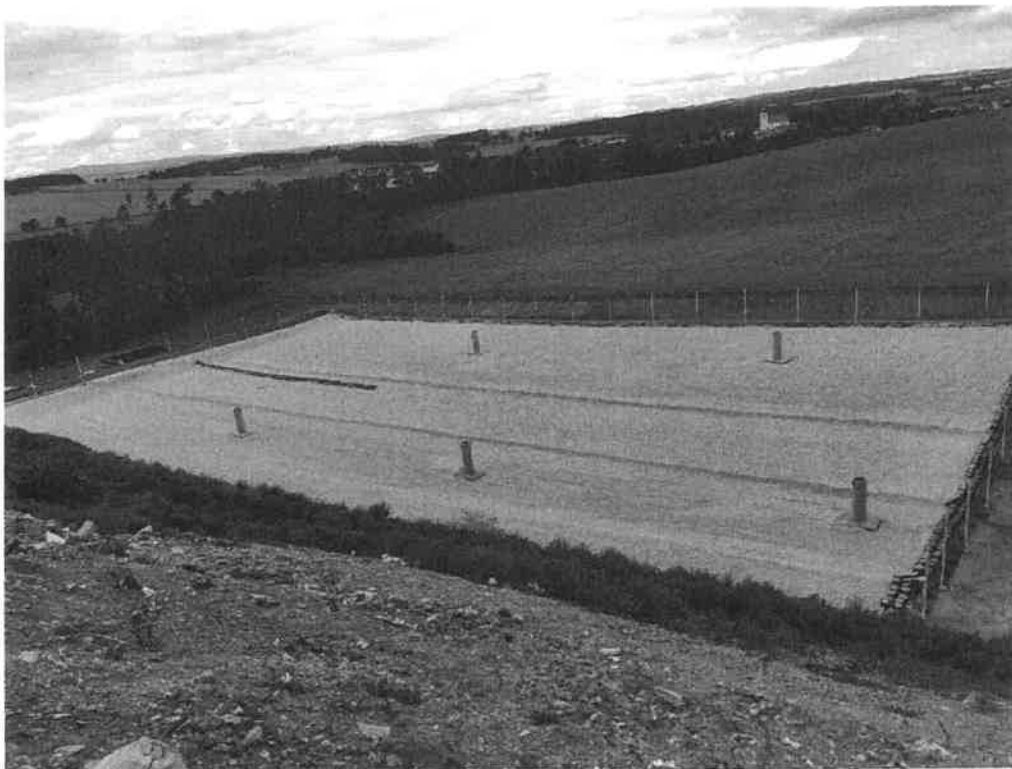
Nové těleso skládky V. etapa.